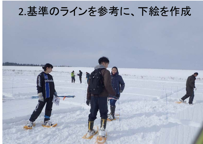
2.基準のラインを参考に、下絵を作成