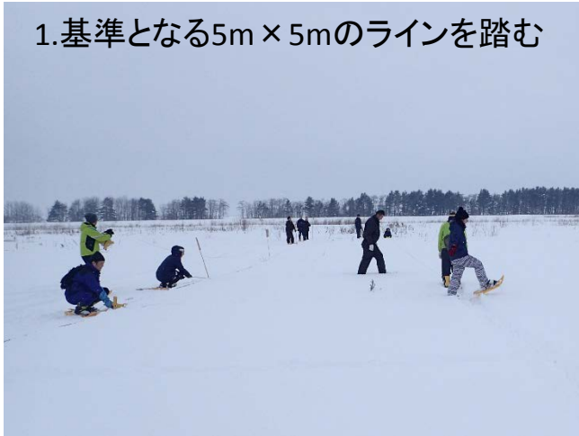
1.基準となる5m×5mのラインを踏む