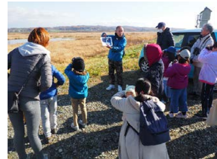
長沼おっ鳥クラブによる野鳥解説

双眼鏡を貸し出し、野鳥観察を行った。 観察にあたって、長沼おっ鳥クラブが遊水地に飛来する 渡り鳥について解説した。 堤防に飛来したタンチョウも静かに観察した。