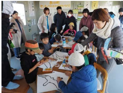
バードセーバーづくりの様子