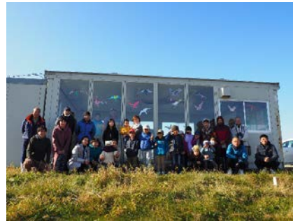
窓にバードセーバーを貼った 鳥の駅マオイトーの前で記念撮影

ガラスに小鳥が衝突してしまうバードストライクの問題とその対策を説明。 対策の一つとして、バードセーバーを作った。 子どもたちは、チュウヒとチゴハヤブサを模した台紙に色を塗り、ハサミで 切り抜いて、鳥の駅マオイトーの窓に貼った。