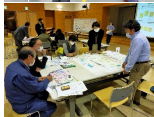
現地見学会・意見交換会の様子