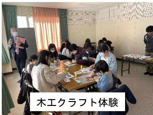
木工クラフト体験