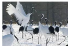
映画「奇跡の子 夢野に舞う」の 1シーン