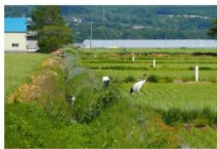
タンチョウも住めるまちづくり (北海道長沼町)

絶滅危惧種に指定されているタンチョウの保護のため、北海道長沼町の「タンチョウも住めるまちづくり」サポーターとしてプロジェクトに継続的に支援しているほか、長沼町がタンチョウを町に呼び戻す活動を描くドキュメンタリー映画「奇跡の子 夢野に舞う」に協賛し、自然と人間の共生を広く呼び掛けています。