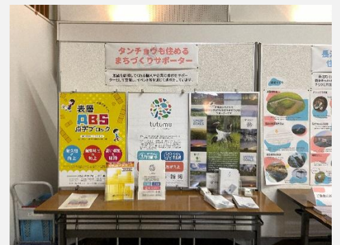
イベントへの参加