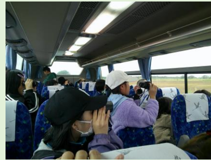
バスからタンチョウを観察