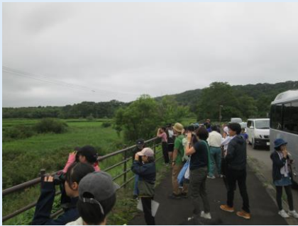
タンチョウの観察