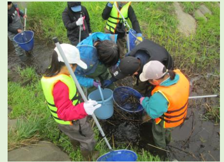
舞鶴遊水地での生きもの探し