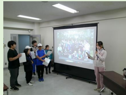
各地域の取組紹介