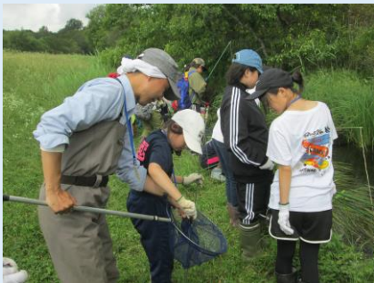
外来種のウチダザリガニの駆除