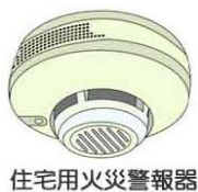
住宅用火災警報器

住宅用火災警報器は、古くなると電子部品の劣化や電池切れなどで火災を感じしなくなることがありますので、10年を目安に交換することをおすすめします。また、定期的に火災時の警報音を確認し、正常に作動するか確かめましょう。