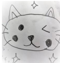
画：Yさん次女ちゃん