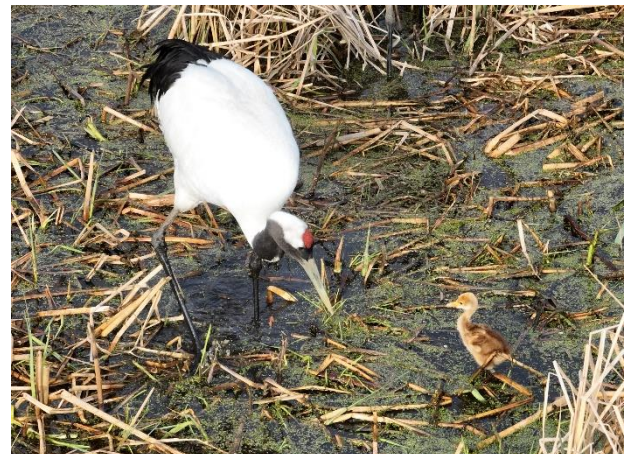
R5. 5. 11 撮影