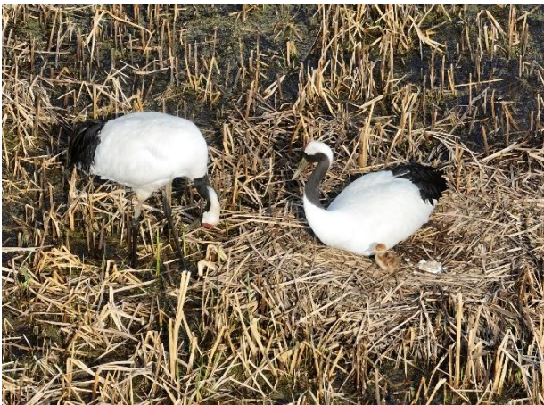
R5. 5. 5 撮影

同協議会のご意見も踏まえ、引き続き、舞鶴遊水地の一部の敷地への立入りを制限させていただきます。タンチョウに警戒心を起こさせないよう、特に繁殖の時期は十分な距離をとる必要があります。見学されるみなさまは、 鳥の駅マオイトーの周辺から優しく見守っていただきますようお願いいたします。