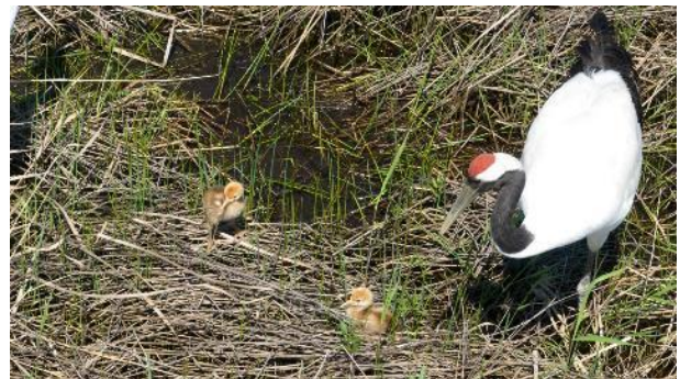
R6. 5. 14 撮影