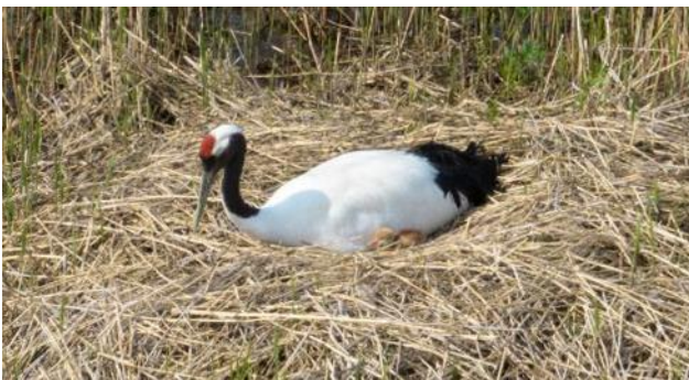
R6. 5. 10 撮影

同協議会の検討結果も踏まえ、引き続き、舞鶴遊水地の一部の敷地への立ち入りを制限させていただきます。タンチョウに警戒心を起こさせないよう、特に繁殖の時期は十分な距離をとる必要があります。見学される皆さまは、 鳥の駅マオイトーの周辺から優しく見守っていただきますようお願いいたします。