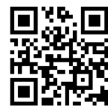
つうえんポータル

右記の二次元コードを読み込み、つうえんポータルにアクセスし、その画面にてお住まいの自治体を選択し、利用申請をしてください。