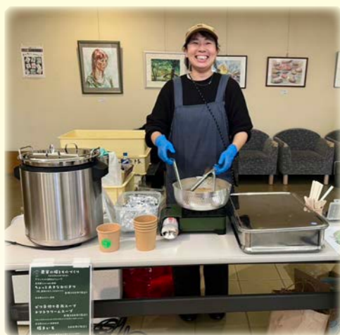
町内イベントに出店しました!

今年も走り抜ける1年にしたいと思いますので皆様、本年もどうぞよろしくお願い致します。