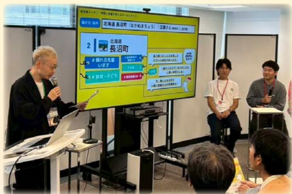
移住イベントでの登壇の様子