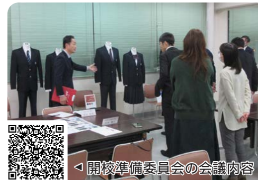
開校準備委員会の会議内容

また、校章については、11月4日から12月1日にかけて実施した校章デザイン案の一般公募において、16点の応募があり、今後の児童生徒の投票に向けて、グループ協議の内容を事務局でとりまとめ、次回会議で提示し、協議することを予定しています。