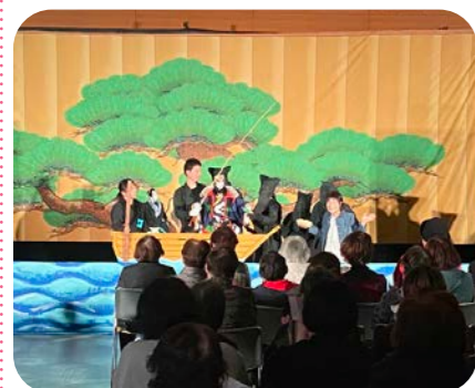
人形浄瑠璃「祝い唄」の様子

12月6日、長沼町女性連絡協議会主催「第28回マヌガーナの集い」が、りふれで開催されました。「地域と絆でつなぐ未来」語り継ぐ伝統と共にく」をテーマに、長沼町生涯学習講座と共催で北海道で唯一の一座「あしり座」による人形浄瑠璃が披露され、町内外から約170名が来場しました。昼食は、JANAがぬま女性部から提供されたおいしいキーマカレーや、フリーマーケットで販売されたお菓子やパンを味わい、思わず笑みがこぼれて自然と会話もはずんでいました。また、お楽しみ抽選会やフリーマーケットも大いに盛り上がり、参加者は楽しいひとときを過ごしました。