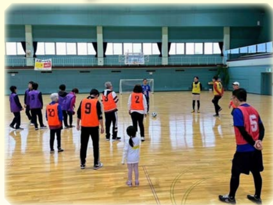
ウォーキングフットボール体験会での風景

世代を超えて交流!ウォーキングフットボール体験会を開催しました 少し前になりますが、昨年12月に長沼町スポーツセンターで地域おこし協力隊主催のウォーキングフットボール体験会を開催しました。 この競技は「走らない」「ぶつからない」「奪わない」といったルールがあり、未就学児からシニアまで誰もが安全に楽しめます。当日は26名が参加し、世代を超えた交流の場となりました。参加者の皆さんからは、無理なく運動ができる点が好評でした。 今後も運動経験を問わず、誰もが地域とつながれる場づくりを検討していきたいと考えています。