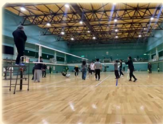
長沼町親睦バレーボール交流会 祝準優勝!!

2025年10月に移住し、ワークショップやメイク講座、誤嚥性肺炎予防のスキンケア講座などを通して美容に携わらせていただき、長沼町の皆さまの温かさに日々ほっこりしております。 今後も定期的に美容イベントを開催し、皆さまの笑顔につながる活動を続けてまいります。