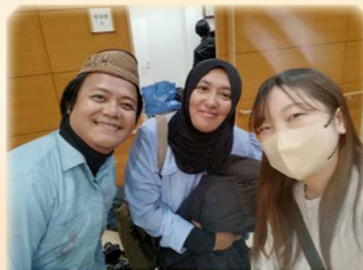
日々、新しい経験と発見

またバレンタインには、小学生向けのお菓子教室で初めて講師を務めました。緊張しましたが、一生懸命作る子どもたちの姿に教える楽しさを実感しました。食を通じた文化や世代のつながりの大切さを学んだひと月でした。