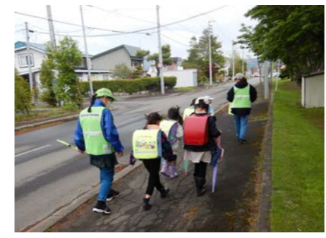
下校巡回の様子（宮下コース）

※上記のほかにはできそうな支援があればできる範囲で結構ですので、登録にご協力をお願いします。