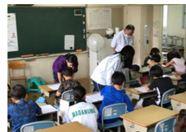
7月25～26日長沼小学校夏休み学習会ボランティア(希望者)