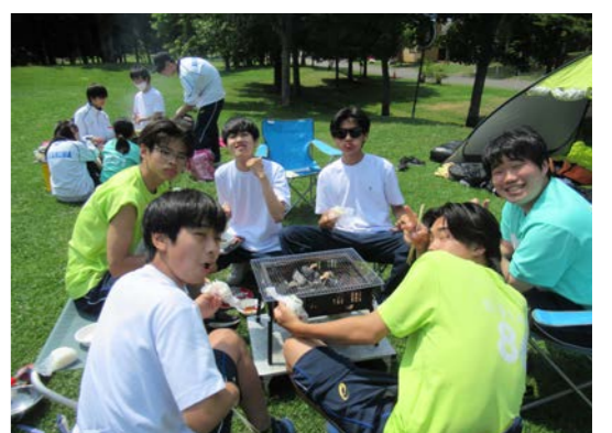
7月21日遠足町内ウォークラリー&BBQ(1年生)