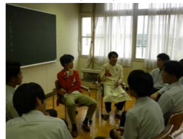
7月19日国際ロータリー青少年留学生と交流(希望者)