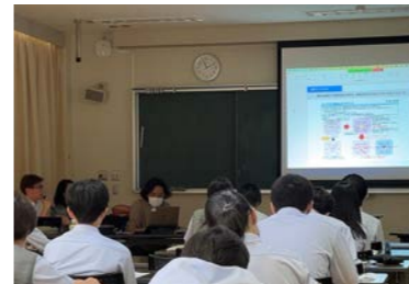
7月18日長沼町・ミサワホーム連携授業(1年生)