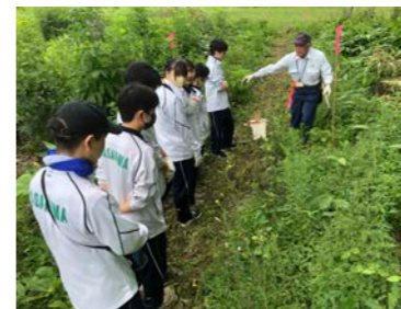
7月18日林業体験(2年生)