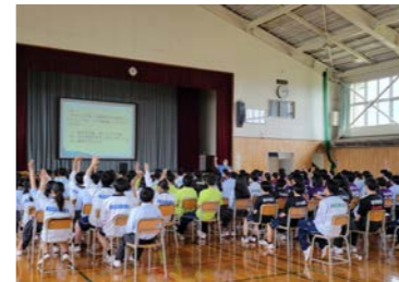
7月11日薬物乱用防止教室(全学年)

学校祭終了後も、長高生がさまざまな場所で多彩な活動を行いました。今月号では、長高生の活動を写真とともに一挙紹介します。