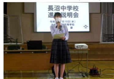
7月19日長沼中学校進路説明会(在校生代表)