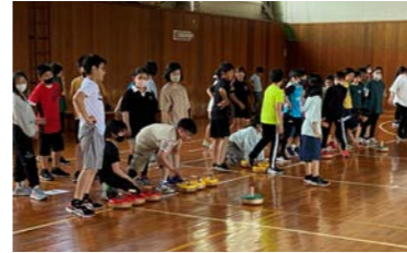
フロアカーリングの様子