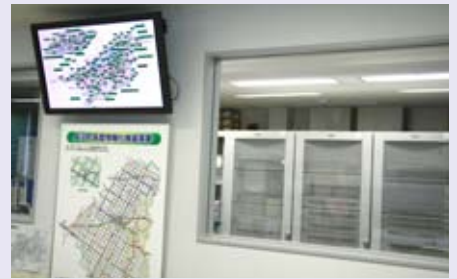
まおいネットトップ画面

まおいネットの回線は、町内全域をカバーしており、希望される町内の世帯や事業所は、所在地にかかわらず、高速インターネットの利用が可能です。