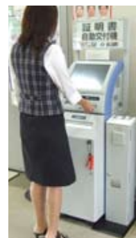
簡易型証明書自動交付機